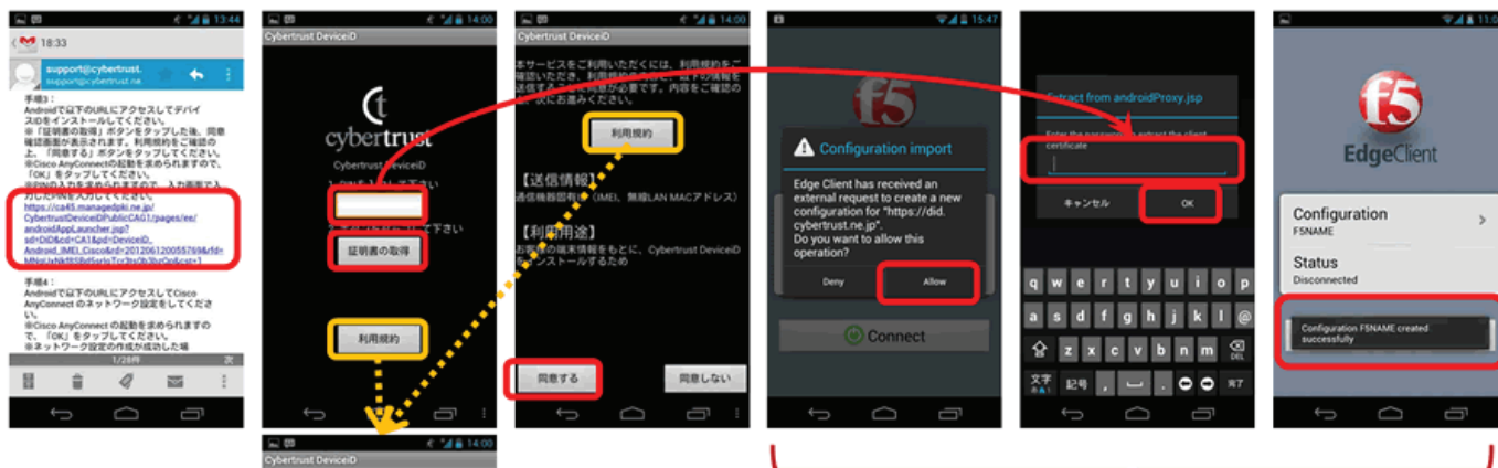
BIG-IP Edge Clientの画面